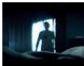
“Blood Will Rise”